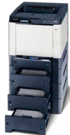
Abbildung mit Optionen.

KYOCERA MITA DEUTSCHLAND GmbH – Otto-Hahn-Str.12 – D-40670 Meerbusch Infoline: 08 00 8 67 78 76 – Fax: +49 (0) 21 59 9 18-106 – www.kyoceramita.de