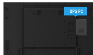
OPS PC SLOT

Die IPS Panel Technologie bietet einen hohen Kontrast und gute Farbbrillanz, bei einem viel größeren Einblickwinkel als bei der standard TN-Panel Technologie.