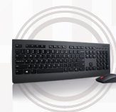
Lenovo Professional Wireless Tastatur- und Mauskombination